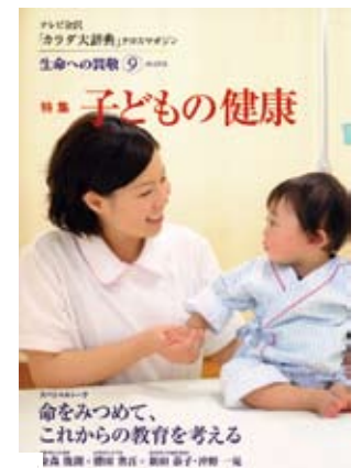
今春発行 第 9 号