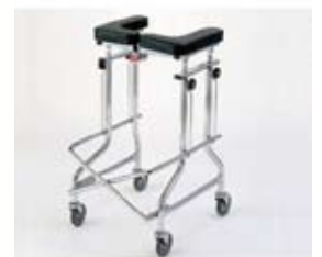
アルコール 1 型歩行補助機