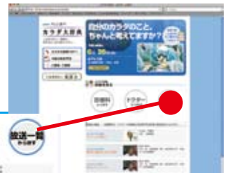
「カラダ大辞典」ホームページ

放送終了後には、いつでもどこでもご覧いただけるように番組ホームページ上にて動画を公開。診療科別、ドクター別、放送一覧のいずれかから閲覧ができます。PC、携帯電話用のサイトが用意されています。