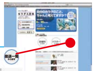
「カラダ大辞典」ホームページ