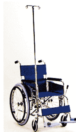
車椅子(自走式・ガートル棒付き)

医療・福祉施設の利用者に必要な車いす、歩行器、備品等を設置し、施設の利便性の向上に務めてまいります。